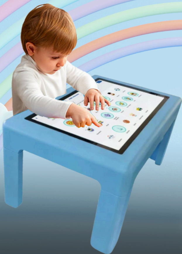
TABLE INTERACTIVE ENFANT